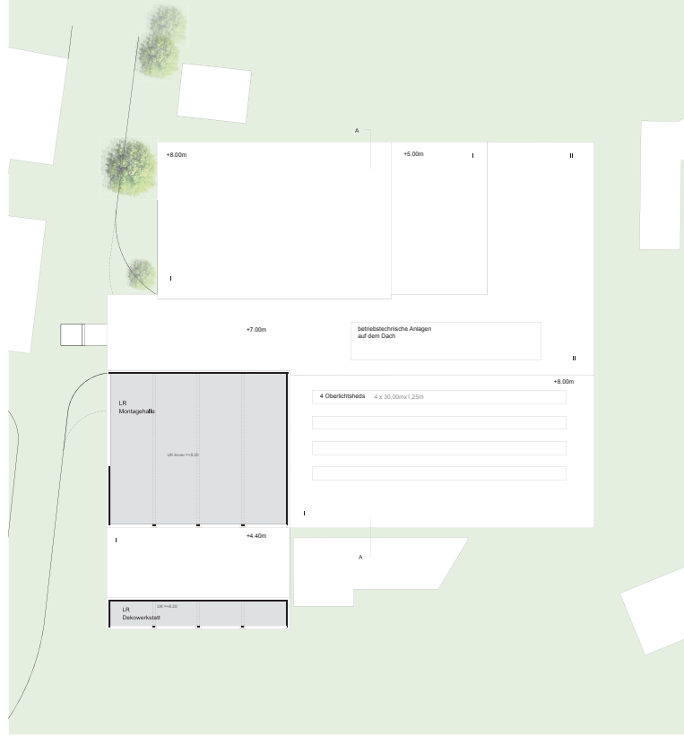
Grundriss Dachgeschoss 1:200