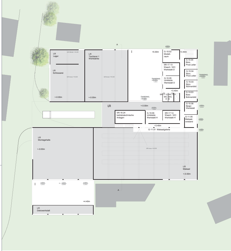
Grundriss 1.Obergeschoss +3.40 1:200