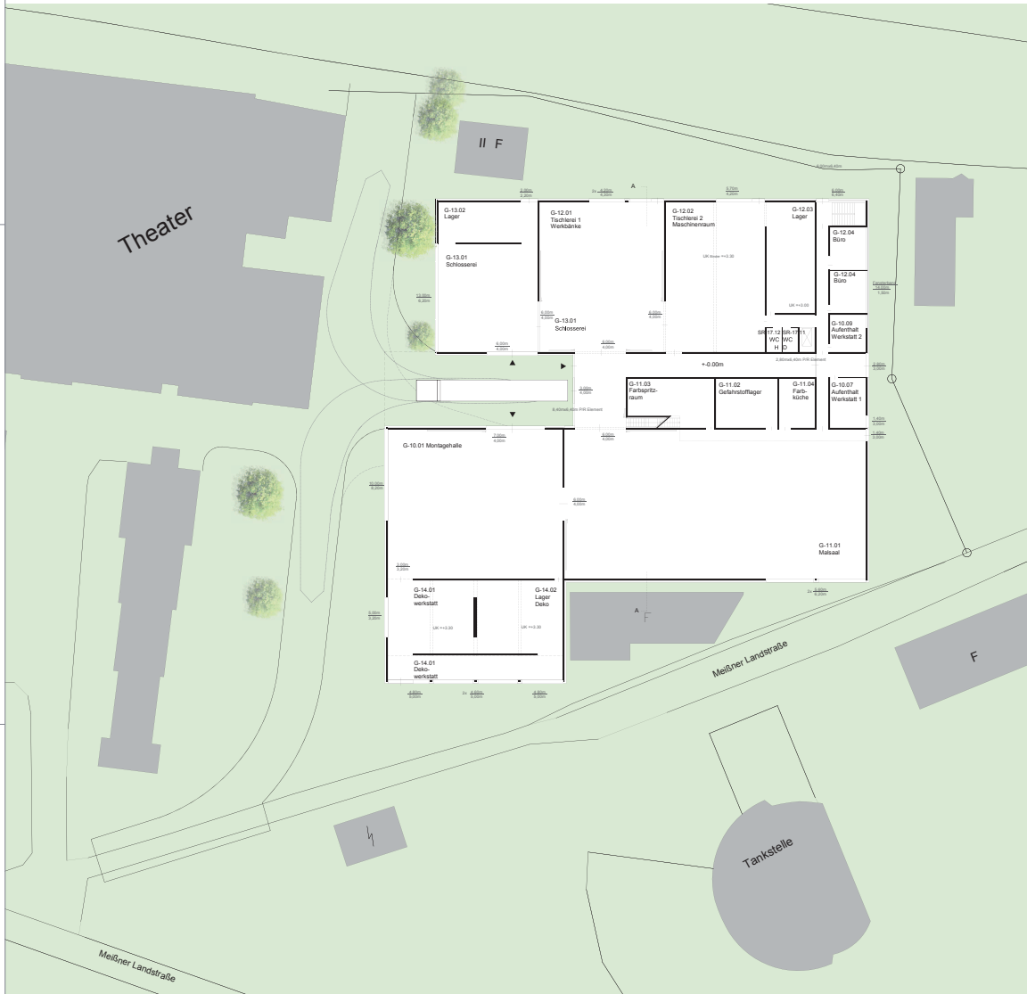
Grundriss Erdgeschoss ±0.00 1:200