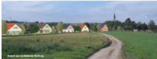
Ansicht aus nordöstlicher Richtung

Bebauungsplan Nr. 342, Dresden-Weißig Nr. 18, Wohnen am Querweg Landeshauptstadt Dresden Stadtplanungsamt Ortschaftsrat 23. Juni 2014