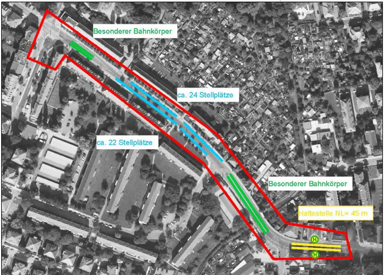
Parkraumbilanz Bestand (ca. 46 Stellplätze)