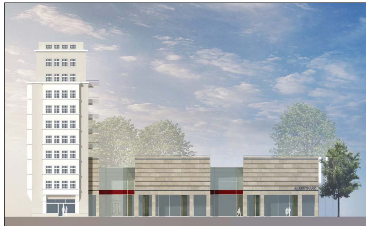
ANSICHT KÖNIGSBRÜCKER STRASSE M 1:250