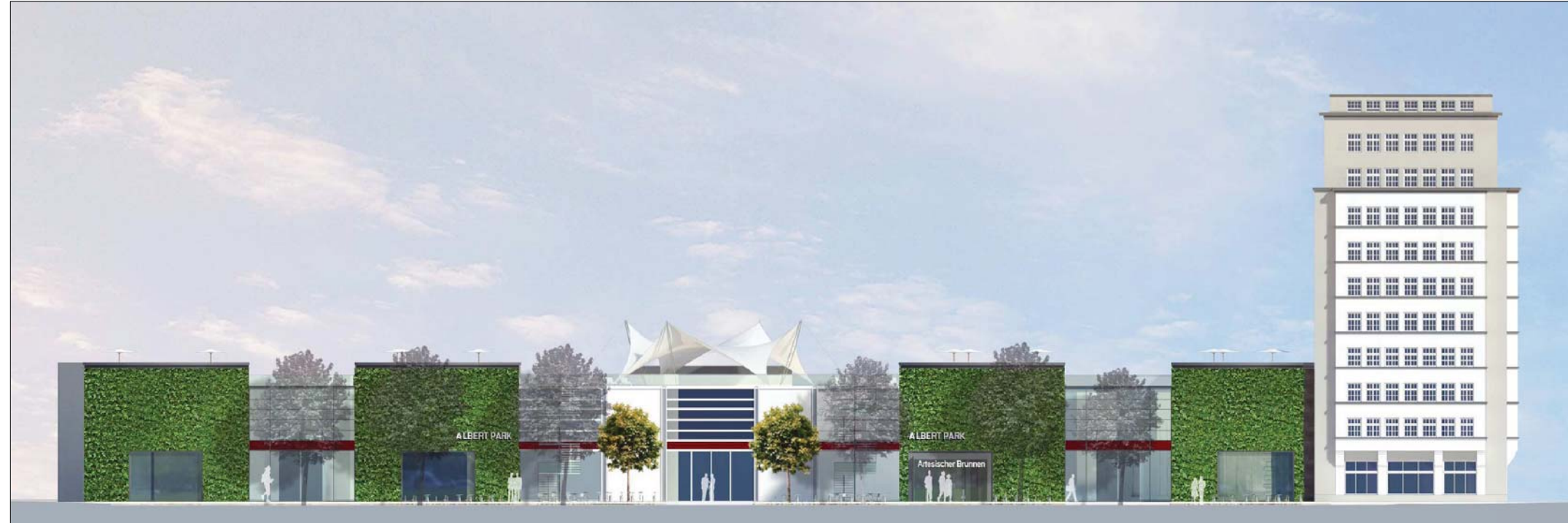
ANSICHT ANTONSTRASSE M 1:250