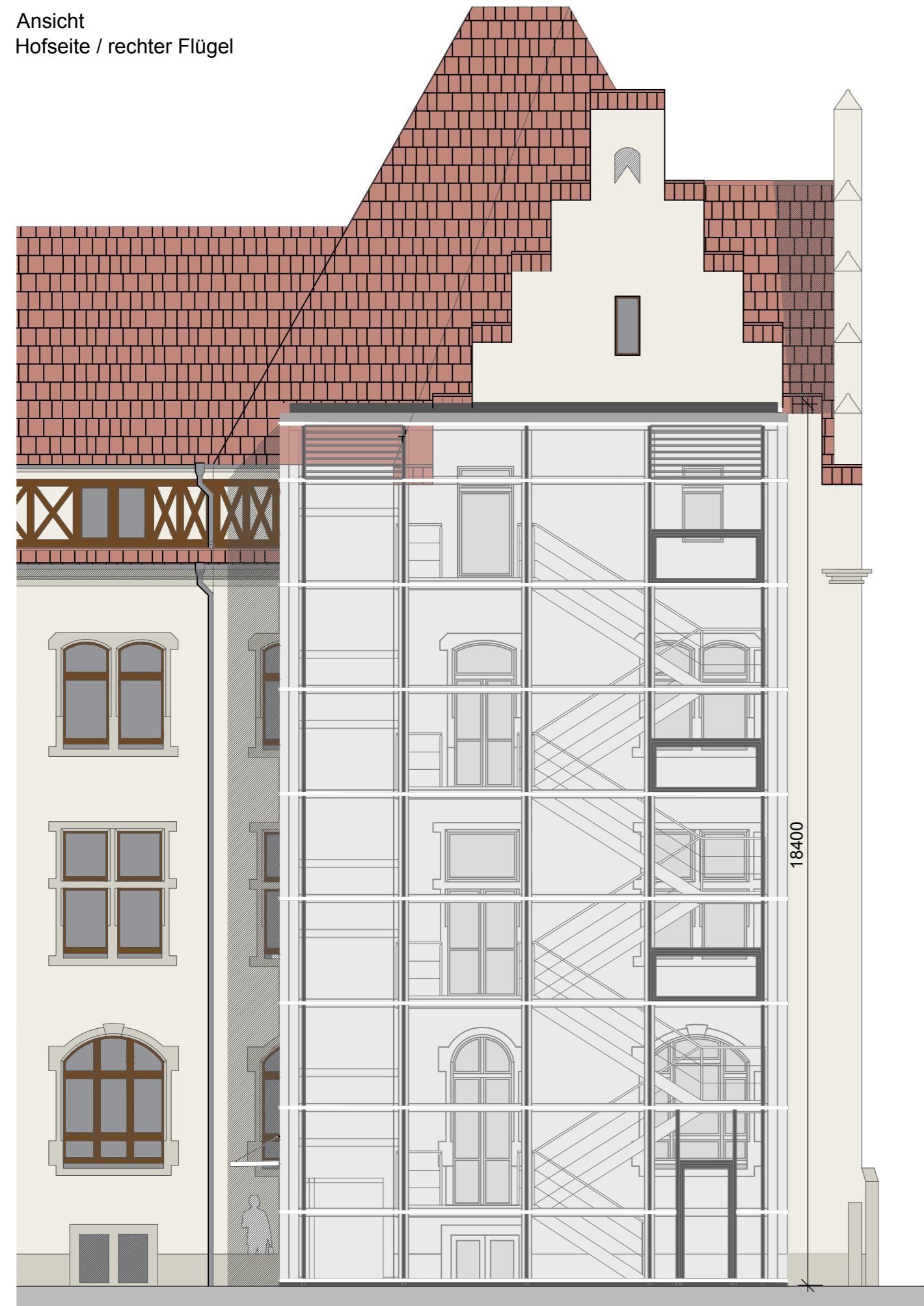
Ansicht Hofseite / rechter Flügel