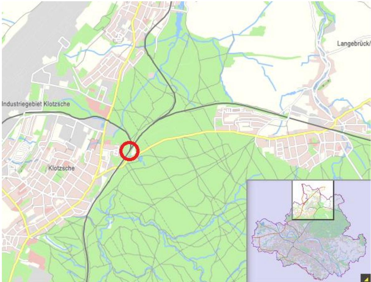
Eisenbahnüberführung km 94,331 G-D Dresden-Klotzsche, Überblick Lage