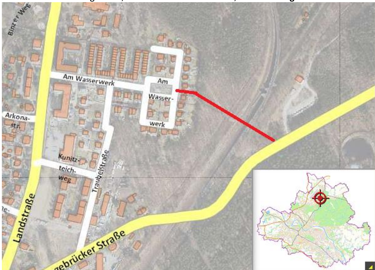
In rot dargestellt die bestehende und mit diesem Antrag öffentlich zu widmende Wegeverbindung (A) Fußweg