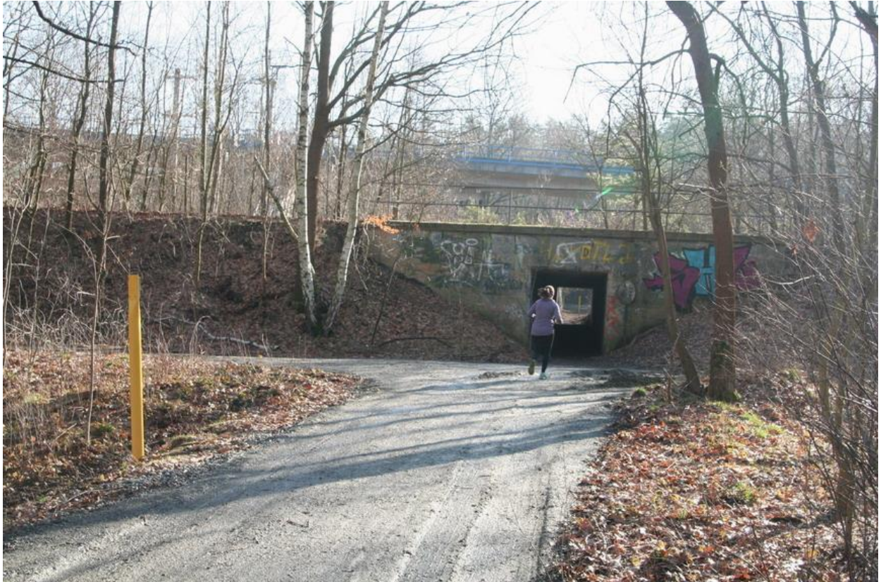
Eisenbahnüberführung km 94,331 G-D Dresden-Klotzsche, Ansicht Stadtseite Klotzsche