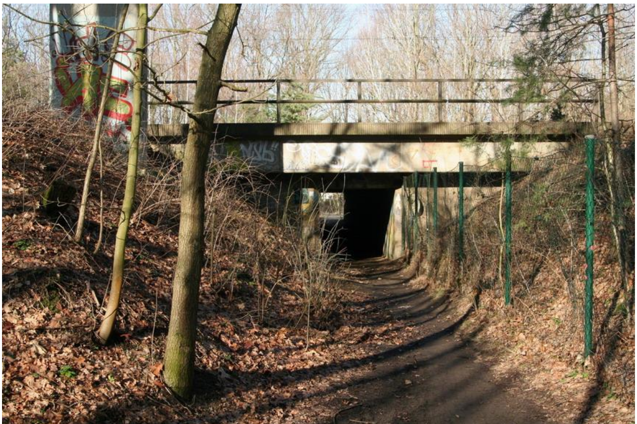
Eisenbahnüberführung km 94,331 G-D Dresden-Klotzsche, Ansicht aus Richtung Heide