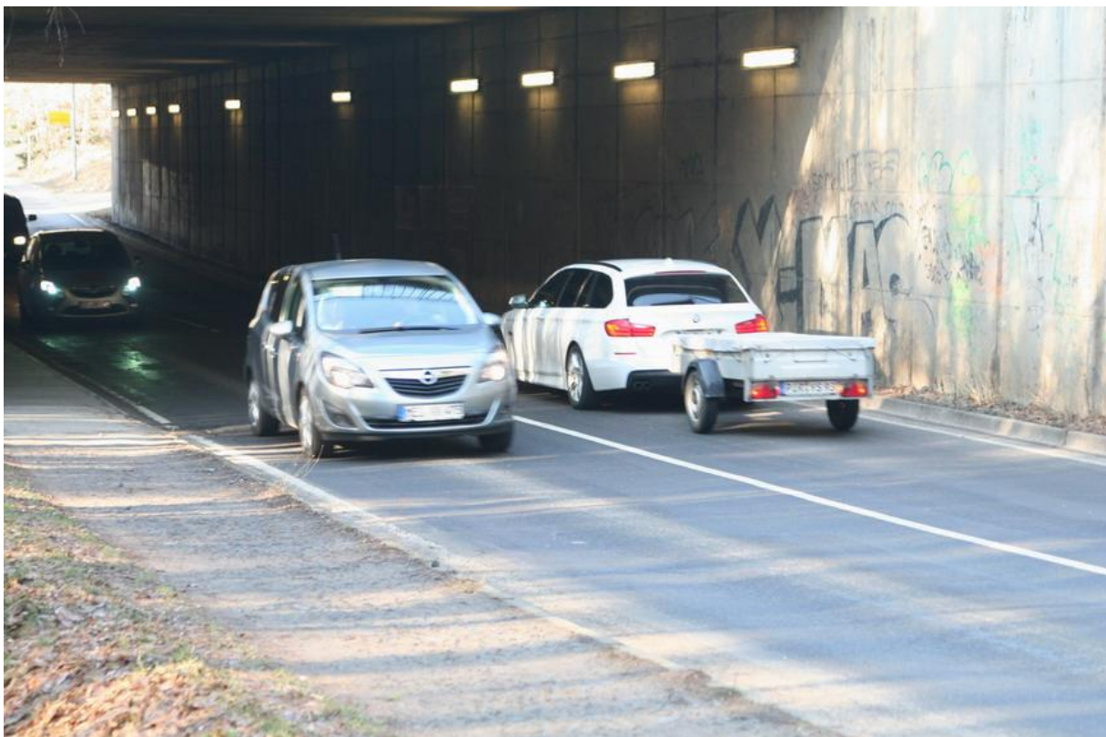
Autotunnel von Langebrück Richtung Klotzsche (70km/h); keine Radwege, einseitiger Fußweg