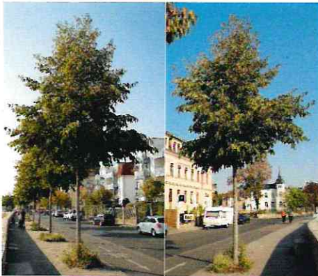
Pflanzung an der Böcklinstraße