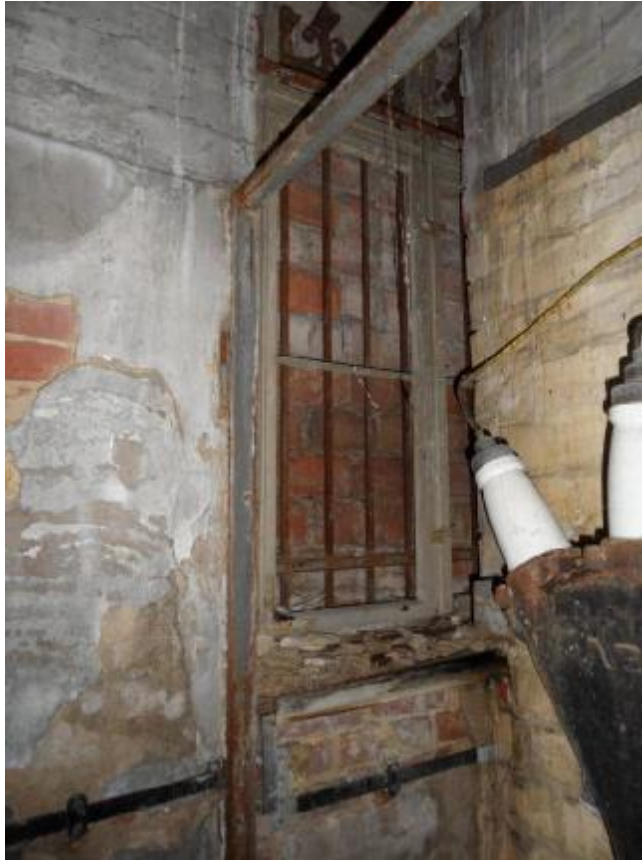
Foto 16: historisches Holzfenster inkl. vollständige Vergitterung