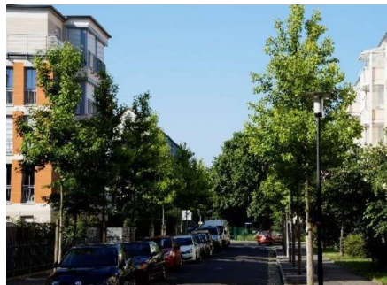
Sorte ‚Paarl‘, Alemannenstraße