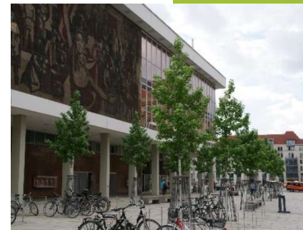
Sorte ‚Worplesdon‘, Schloßstraße