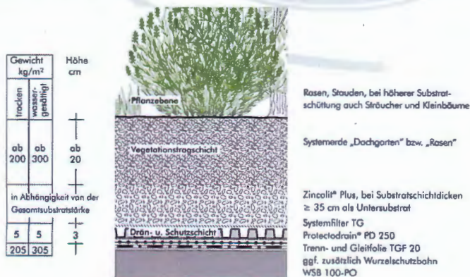
System Zincolit plus

Als Ausgleichsmaßnahmen für die höhere Versiegelung sehen HA die geplante Begrünung des aus dem Hauptbaukörpers hervorstehenden Garagendaches im Hofbereich- d.h. ein Systemaufbau nach Zinco dort ca. 60 ... 80 cm hoch mit einer intensiven Begrünung: