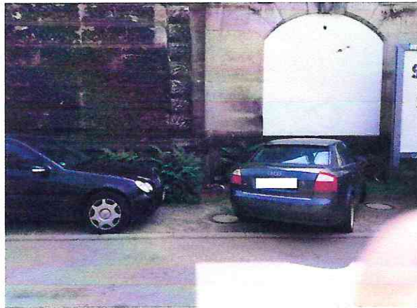
Bild 3 Zur Bepflanzung vorgesehener Bereich