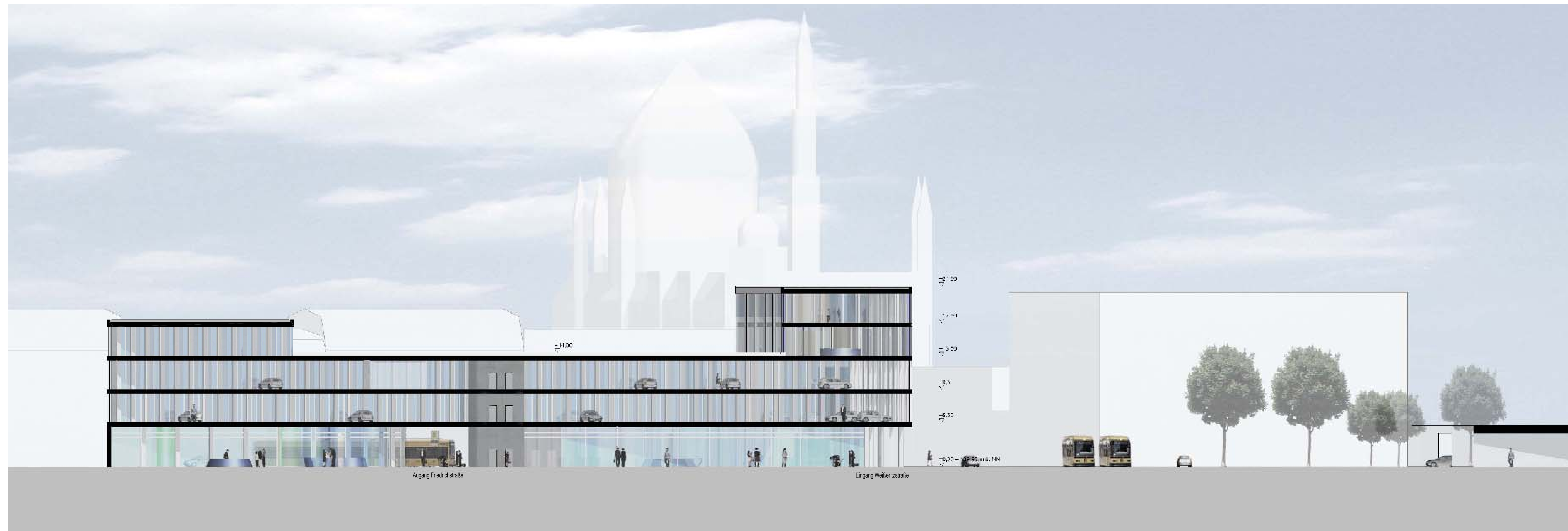
1 Längsschnitt Passage 1:200