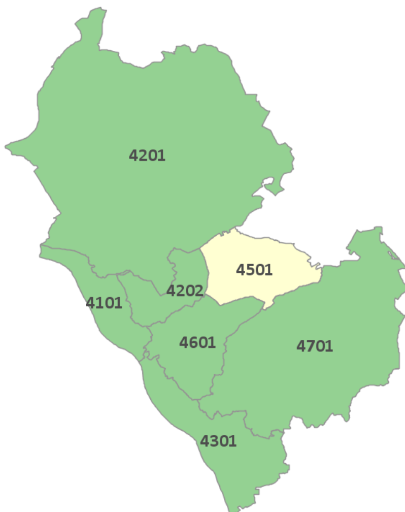
Abbildung 2: Darstellung des Belastungsindex für den Stadtraum 7 nach Sozialbezirken

eigene Darstellung; Quelle: Landeshauptstadt Dresden, Kommunale Statistikstelle