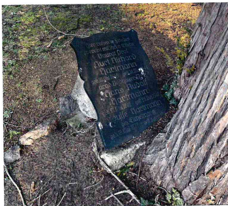
Detailaufnahme der Inschriftentafel

Die gärtnerische Herrichtung soll im Anschluss an die Arbeiten durch den Freundeskreis des Trinitatis- und Johannisfriedhof im Frühjahr 2023 erfolgen.