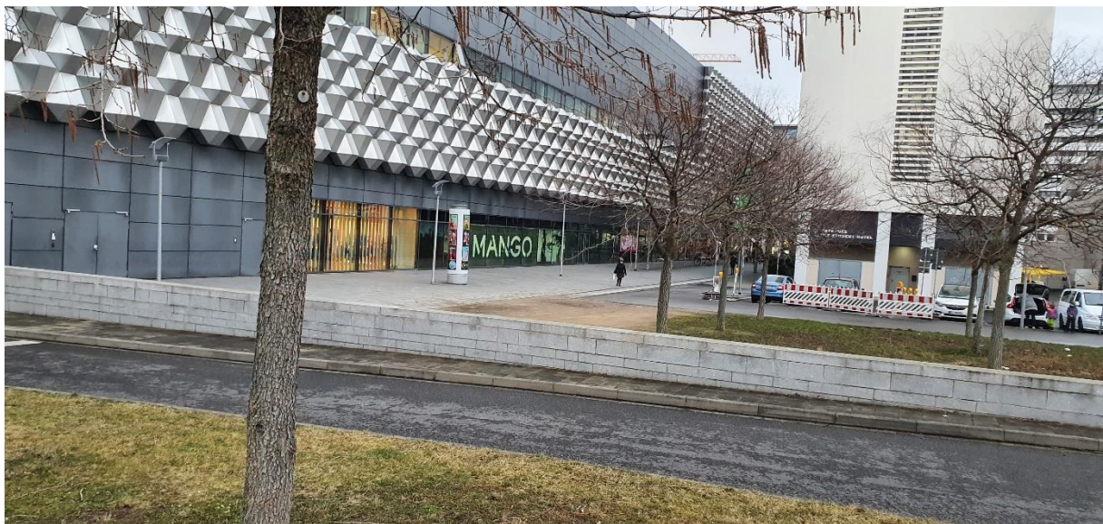
Abbildung 2: Geländeansicht