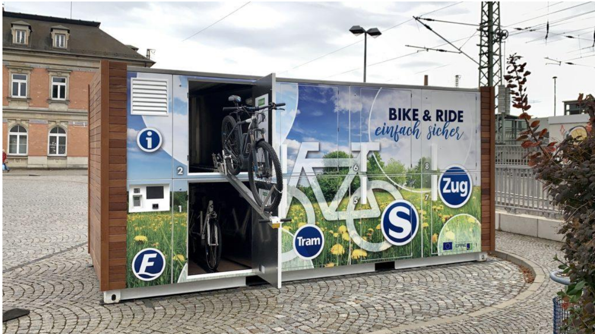
Abbildung 3: Beispiel innovative Radabstellanlage velobrix