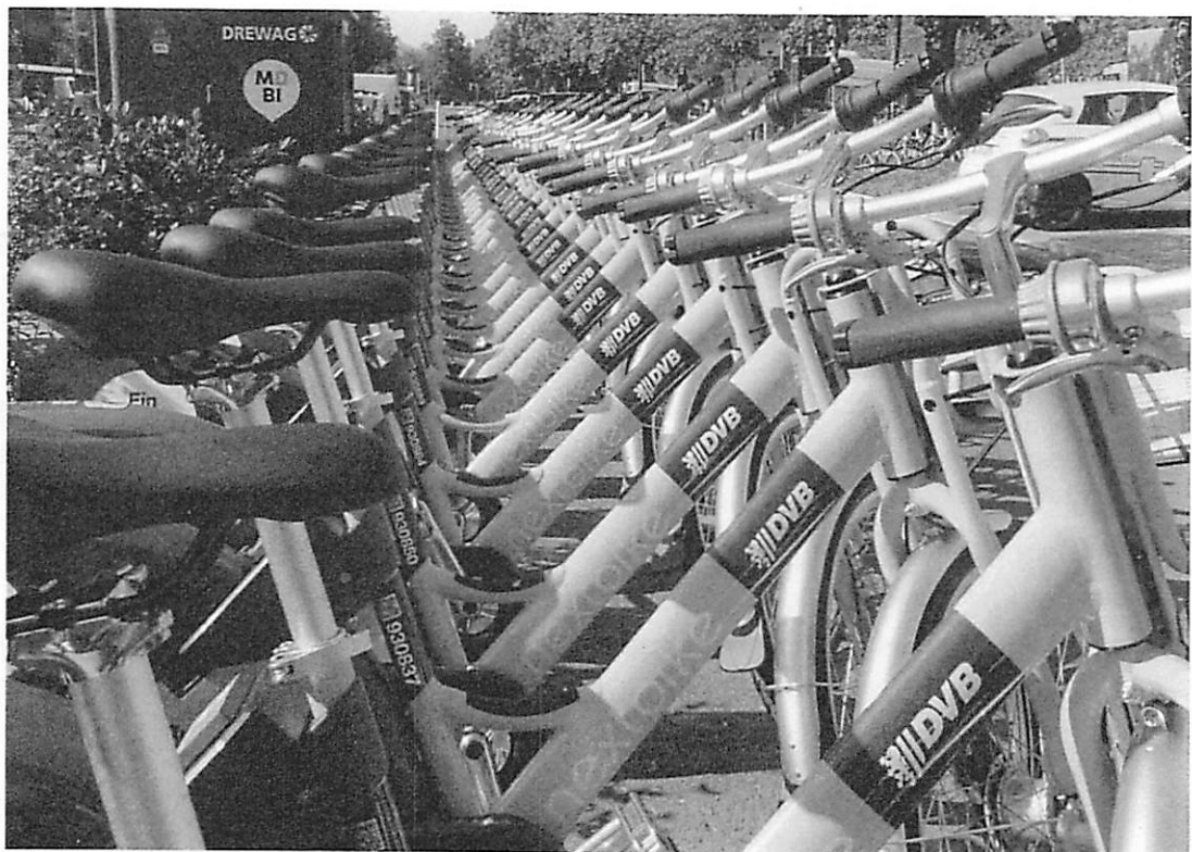
Anlage 2: Mobi-Punkt Fahrradstation

CDU Dresden Ortsverband Altstadt/Großer Garten An der Kreuzkirche 6 01067 Dresden