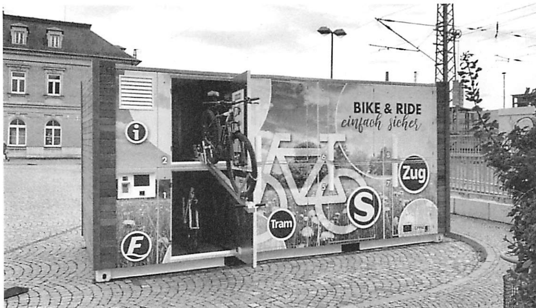
Abbildung 3: Beispiel innovative Radabstellanlage velobrix