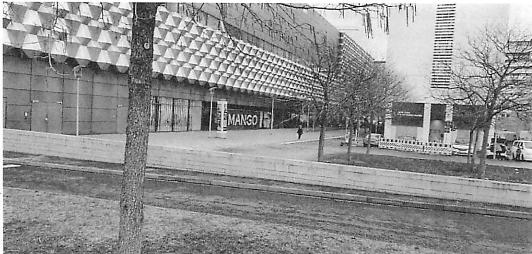
Abbildung 2: Geländeansicht

CDU Dresden Ortsverband Altstadt/Großer Garten An der Kreuzkirche 6 01067 Dresden