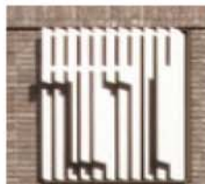
Türen pulverbeschichtetes Aluminium, Farbton RAL 8014 Sepiabraun mit aufgeklebten erhabenen pulverbeschichteten Aluminiumbuchstaben, Farbton RAL 8014 Sepiabraun