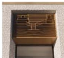
Detailroste Aluminium, Farbton RAL 8014 Sepiabraun Detailbild foliert