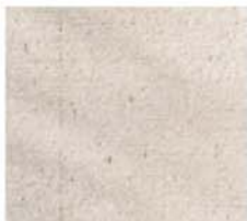
Fassadenverkleidung Jura Kalkstein Beige gestockt