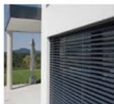
Raffstoren pulverbeschichtetes Aluminium, Farbton RAL 8014 Sepiabraun