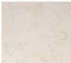
Fassadenverkleidung Jura Kalkstein Beige geschliffen