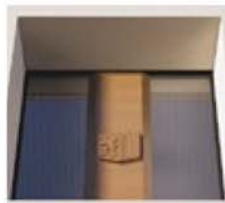
Detailpaneel mit geprägtem Logo Aluminium, Farbton RAL 8014 Sepiabraun