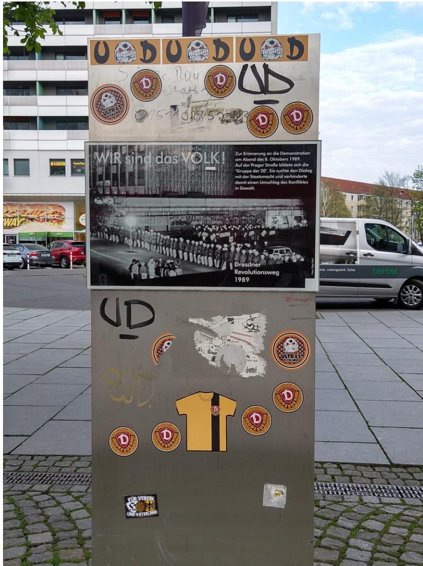
Abbildung 1: Steele