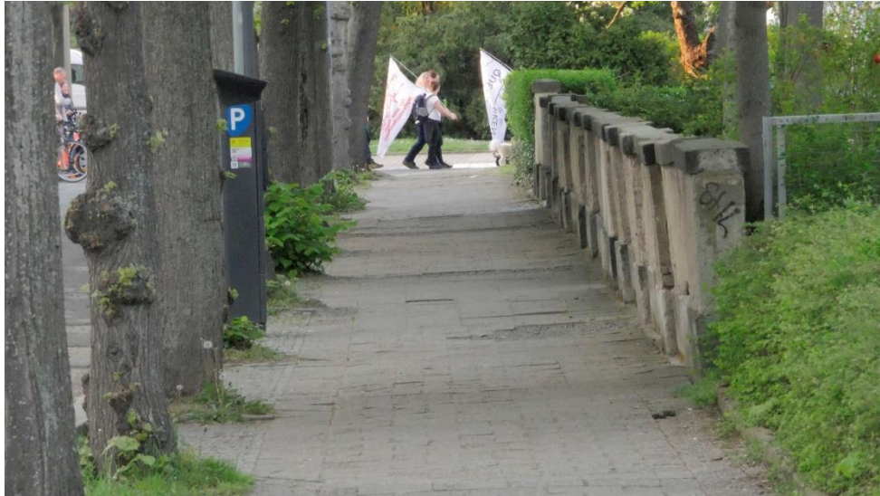
Abbildung 1: Vor-Ort-Ansicht