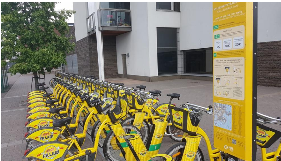
Abbildung 2: Beispiel Helsinki