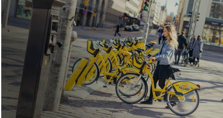
Abbildung 3: Beispiel Helsinki