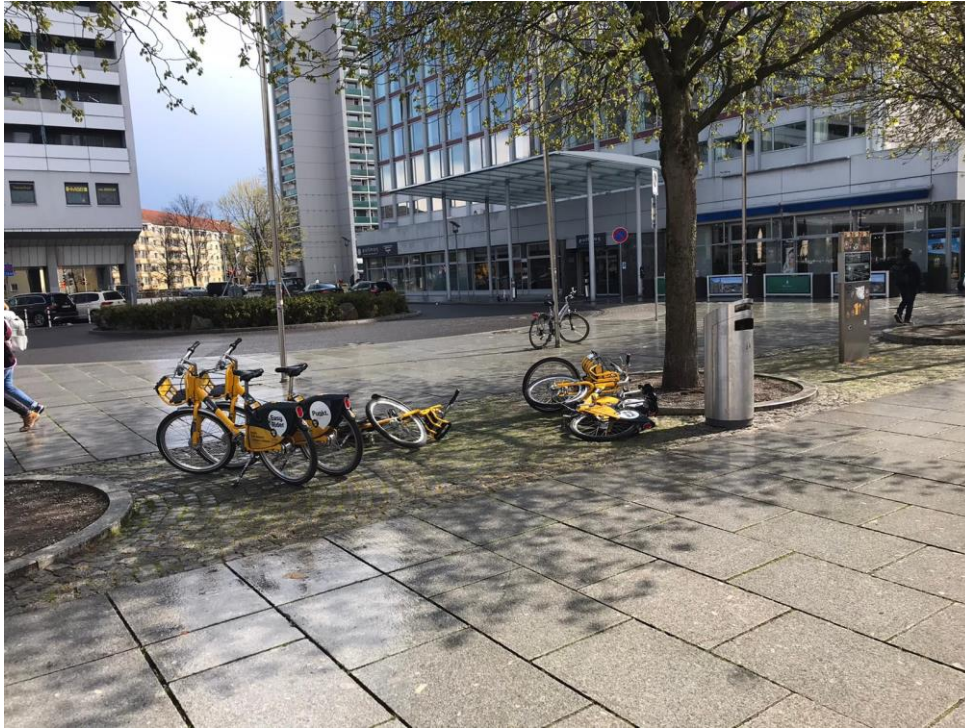
Abbildung 1: Beispiel Prager Straße (Pullman-Hotel)