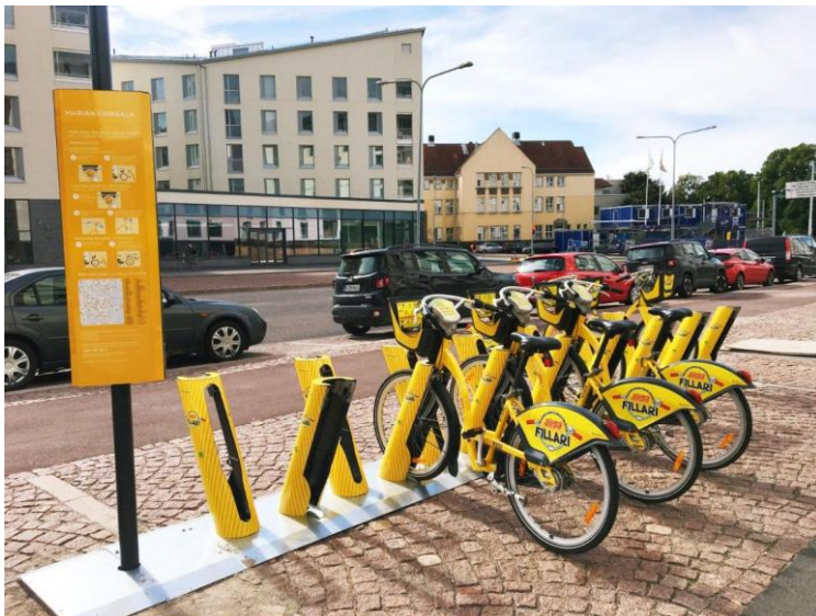
Abbildung 4: Beispiel Helsinki