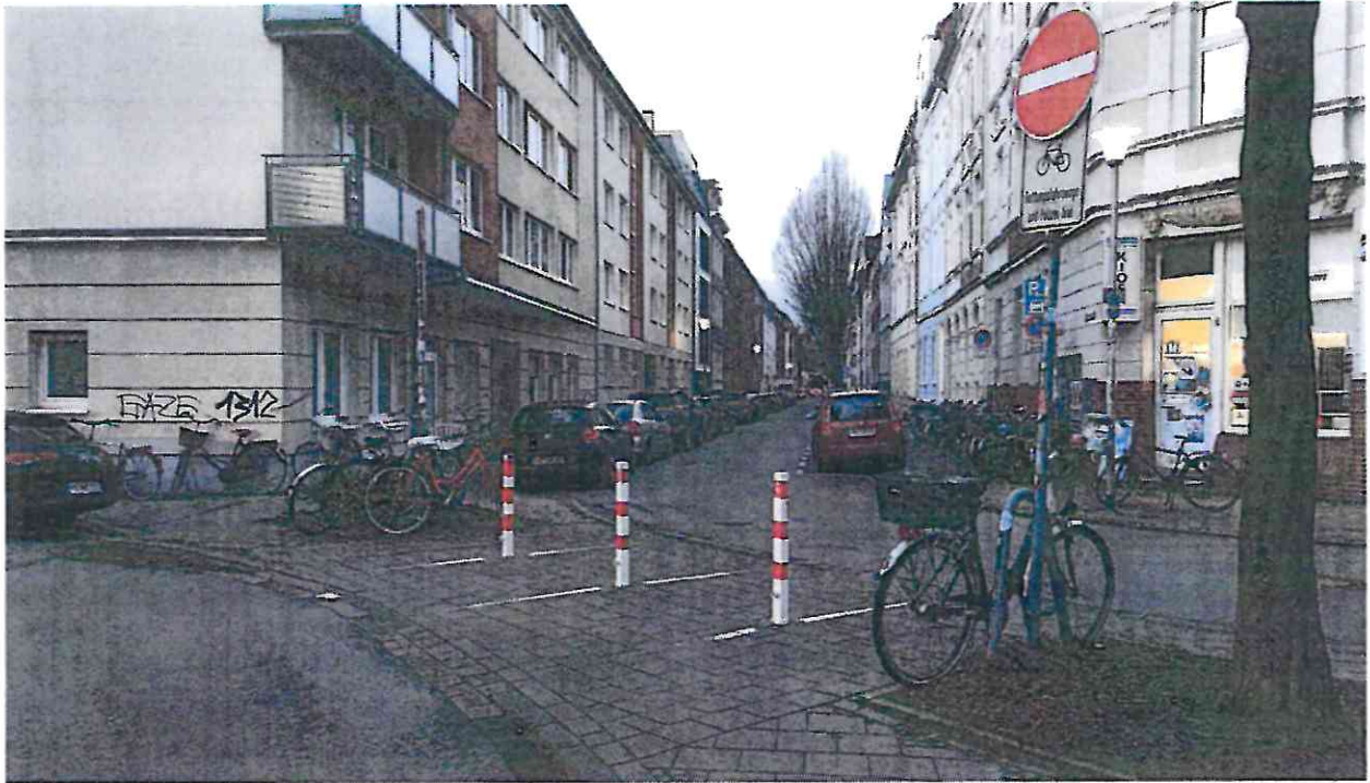
Abb. 1 Beispiel für einen modalen Filter in Münster